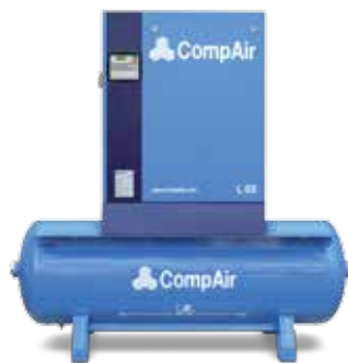
Kompressor auf Druckluftbehälter